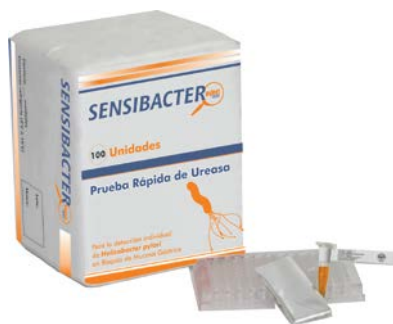
Figura 1. Presentación Comercial del Sensibacter Pylori test®.